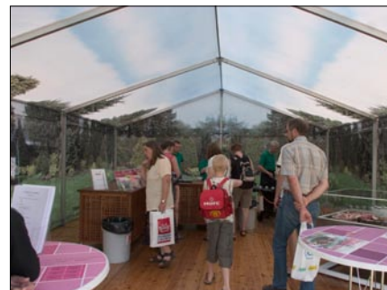
Indersiden af teltdugen.

Cafébordene bliver samtidig brugt til at afvikle en quizkonkurrence, hvor der på hvert bord er printet spørgsmål til konkurrencen.