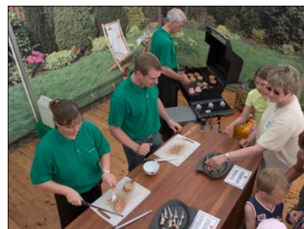
Der blev uddelt smagsprøver fra grillen til alle besøgende.

Ideen bag teltet er at skabe en ekstra dimension til standen og give de besøgende en usædvanlig oplevelse.