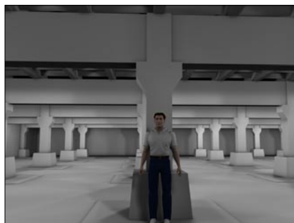
En del af udstillingen planlægges i et nedlagt vandreservoir under bygningen.

CATs hovedopgave er at udvikle en række udstillingselementer, som formidler informationer om vandmiljøet på en dynamisk og sjov facon.