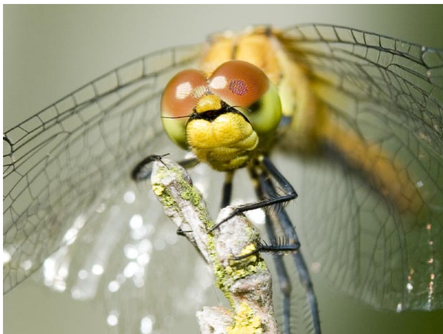
CATs fotografer går i disse dage helt tæt på dyrene i mosen.

CAT vandt i 2004 en konkurrence om udvikling og opførelse af udstillingen i Lille Vildmosecentret.