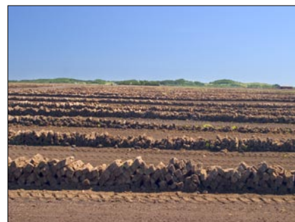
Portlandsmosen er et af de mest spændende områder i Lille Vildmose.

Arbejdet med udstillingen er så småt begyndt at bevæge sig fra planlægningsfasen over i den mere praktiske fase, bl.a. i form af udvikling af tekster og grafik til udstillingsvægge og interaktive skærme. Næste skridt i processen er den fysiske del af udstillingen, hvor udstillingselementerne begynder at tage form, og foto og video til elementerne bliver færdiggjort. Udstillingen skal stå klar til besøgende d. 10. februar 2006.